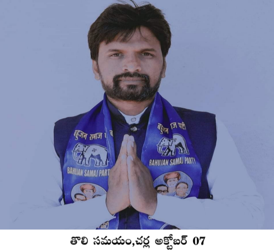
తొలి సమయం, చర్ల అక్టోబర్ 07