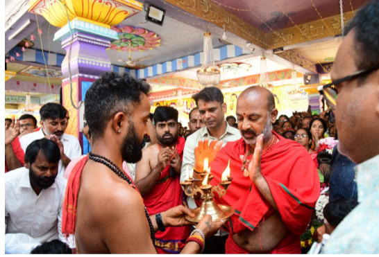
భక్తులతో కలిసి ప్రత్యేక పూజలు నిర్వహించారు. అనంతరం కరీంనగర్ పార్లమెంటు పరిధిలోని ప్రజల సమస్యలకు

కరీంనగర్ మహాశక్తి ఆలయంలో శ్రీ దేవి శరన్నవరాత్రి ఉత్సవాలు అట్టహాసంగా జరుగుతున్నాయి. నవరాత్రి ఉత్సవాల్లో భాగంగా సోమవారం ( 5వ రోజు) అమ్మవారు మహా చండీ దేవిగా (స్కందమాత ) దర్శనమిచ్చారు. అమ్మవారిని ప్రత్యేకంగా పండ్లతో అలంకరించారు. దేవి దర్శనం కోసం కరీంనగర్ పార్లమెంటు పరిధిలో పాటు ఇతర జిల్లాల నుంచి భక్తులు తరలివచ్చి అమ్మవార్లను దర్శించుకున్నారు. భక్తుల తాకిడితో ఆలయం పరిసర ప్రాంతాలు రద్దీగా మారాయి. ఇక అమ్మవార్ల ఆలయం భవానీ మాల వేసుకున్న భక్తులతో సందడిగా మారింది. అమ్మవారి నినాదాలతో ఆలయ ప్రాంగణం మాడుద్రాగింది. మరోవైపు కేంద్ర హెంకా శాఖ సహాయ మంత్రి బండి సంజయ్ కపూర్ భవానీ