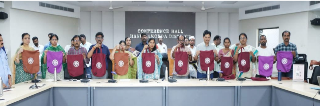
తొలి సమయం, హన్మకొండ, అక్టోబర్ 07

పర్యావరణ హితానికి క్లాత్ బ్యాగులనే వినియోగించాలని హనుమకొండ జిల్లా కలెక్టర్ ప్రావీణ్య అన్నారు. సోమవారం హనుమకొండ కలెక్టర్లే లోని కాసారీస్ హాలులో మెప్పా