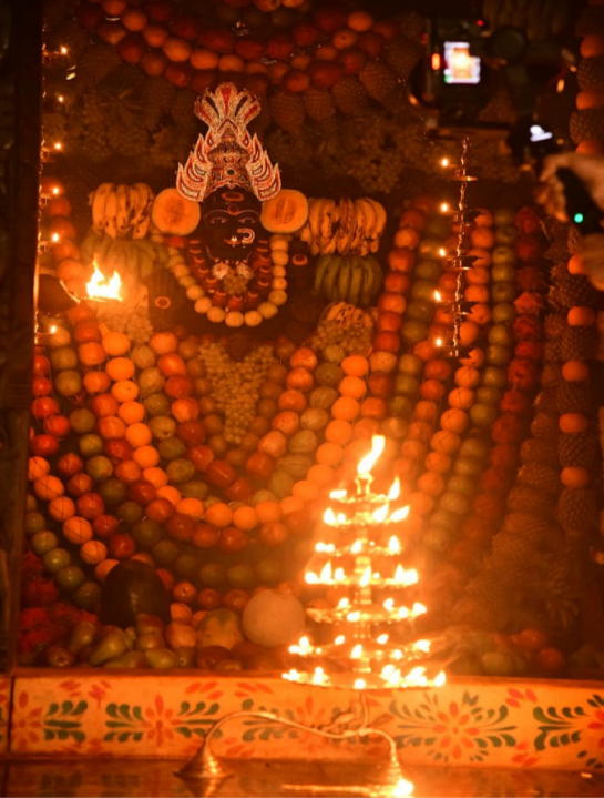
తొలి సమయం, కరీంనగర్, అక్టోబర్ 07

- 5వ రోజు మహా చండీ దేవిగా (స్కందమాత ) అమ్మవారి దర్శనం - ప్రత్యేకంగా పండ్లతో అమ్మవారి అలంకరణ - అమ్మవారి దర్శనం కోసం వేలాదిగా తరలివచ్చిన భక్తులు