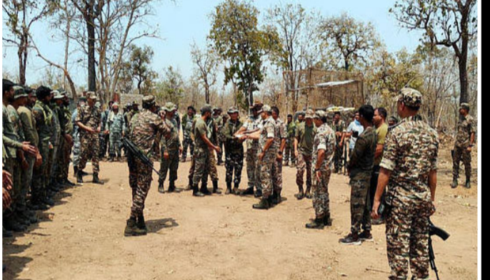
సమస్య పరిష్కారం అవు తుందిని తాము భావిస్తున్నామని అయినా ప్రభుత్వం భిన్నంగా ఆలోచిస్తోందని నిన్ను బస్టర్ మా వోయిస్టు పార్టీ అన్యాయ రూపే లేఖ విడుదల చేసిన సంగతి తెలిసింది. అయినా సైన్యం మాత్రం సెల్స్ ఆపరేషన్ కంటిన్యూ చేస్తోంది...