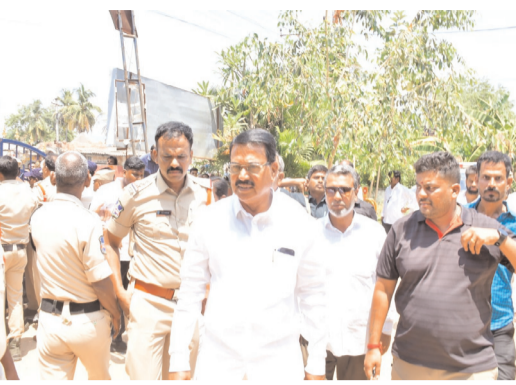
తొలి సమయం, వనపర్తి మార్చి 26

వనపర్తి జిల్లా కేంద్రంలోని టౌన్ పోలీస్ స్టేషన్ లో అక్రమ కేసు లో అరెస్టు చేసిన నాయకులను కలిసి డైర్యాన్ని చెప్పిన మాజీ మంత్రివర్గం సభ్యులు శ్రీ సింగిరెడ్డి నిరంజన్ రెడ్డి. బాలికపై జరిగిన