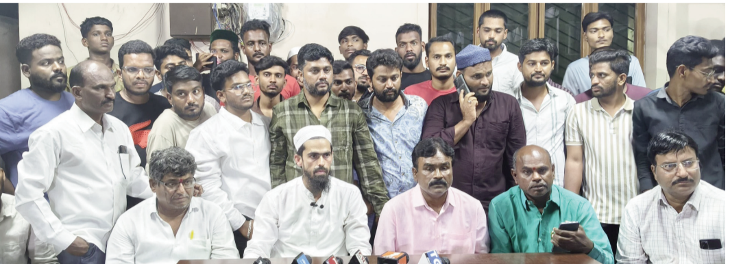
తొలి సమయం, వనపర్తి మార్చి 26