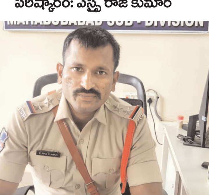
తొలి సమయం, కొత్తగూడ 26 మార్చి 2026