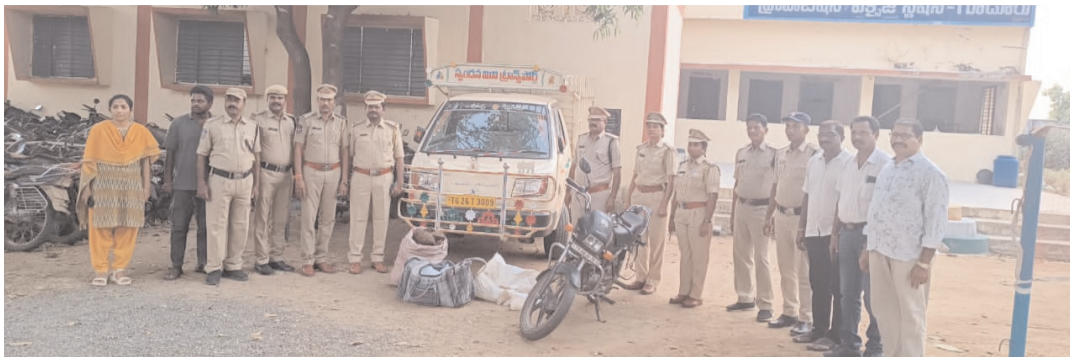
తొలి సమయం కొత్తగూడ 25 ఏప్రిల్ 2026