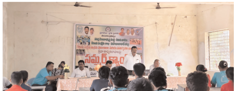
తొలి సమయం కొత్తగూడ 25 ఏప్రిల్ 2026