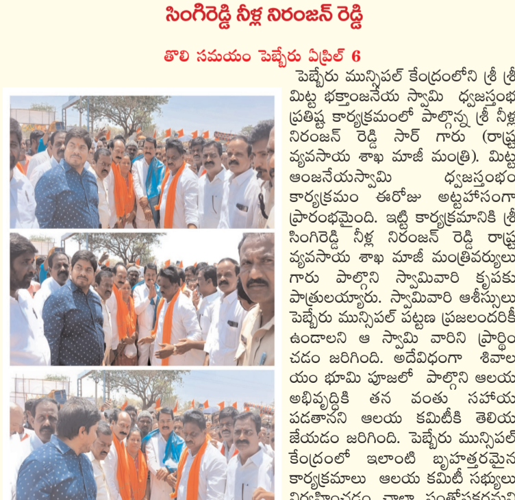
తొలి సమయం పెబ్బేరు ఏప్రిల్ 6