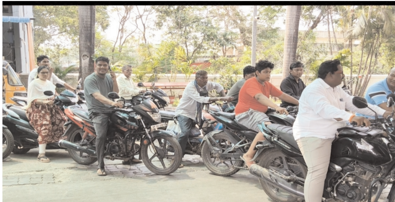
తొలి సమయం, ఇల్లందు; ఏప్రిల్, 27:

భద్రాద్రి కొత్తగూడెం జిల్లా ఇల్లందులో డీజిల్, పెట్రోల్ కొరతతో వాహనదారులు తీవ్ర ఇబ్బందులు పడుతున్నారు. పట్టణం శివారు ప్రాంతాల్లో ఉన్న ఆరు పెట్రోల్ బంకుల్లో సగానికి పైగా సరఫరా లేకపోవడంతో సమస్య మరింత తీవ్రమైంది. ఇంధనం లభ్యమయ్యే బంకుల వద్ద వాహనాలు భారీగా భారాలు తీరడంతో వాహనదారులు గంటల తరబడి వేచి ఉండాల్సి పరిస్థితి ఏర్పడింది. కొరత కారణంగా కొందరు ముందుగానే డీజిల్ నిల్వలు చేసుకోవడం వల్ల కృత్రిమ కొరత ఏర్పడుతోందని స్థానికులు అంటున్నారు. ఇదిలా ఉండగా, జిల్లాలో ఇంధనం కొరత లేదని అధికారులు చెబుతున్నప్పటికీ, వాస్తవ పరిస్థితులు కొన్ని ప్రాంతాల్లో భిన్నంగా కనిపిస్తున్నాయి. సరఫరా అందిన వెంటనే వాహనదారులకు ఇంధనం అందిస్తున్నామని పెట్రోల్ బంక్ డిలర్లు తెలిపారు.