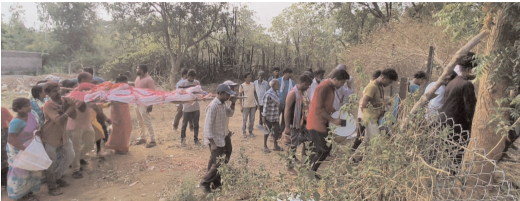
తొలి సమయం, ఇల్లందు; ఏప్రిల్ 27:

ఇల్లందు మండలం, ఇందిరా నగర్ పంచాయతీ లోని రెండోవ వార్డ్ లో వద్దైర కాళానికి చెందిన రాఫోలు. రాములు అనారోగ్యం తోమ్మతి చెందినాడు. స్థానికంగా ఉన్న అటవీ భూమిలో అంత్యక్రియలు నిర్వహిస్తామని ఏర్పాట్లు చేస్తున్న క్రమంలో అటవీ అధికారులు అడ్డుకున్నారు. స్థానిక ప్రజలకు అధికారుల మధ్య వాగ్వాదం చేటుచేసుకున్నది. పోలీసులు వచ్చి సమస్యను పరిష్కరించాలని చూడగా స్థానిక మహిళలు గత కొన్ని సంవత్సరాలుగా మేము ఇక్కడే అంత్యక్రియలు నిర్వహిస్తున్నామని అటవీ అధికారులు వేసిన కంచె ను తొలగించి శవానికి అంత్యక్రియలు నిర్వహించారు. స్థానికులు మాకు స్వశాసన వాటిక ఏర్పాటు చేయాలని ప్రజాప్రతినిధులకు ఎన్నిసార్లు మోర పెట్టకున్న పట్టించుకోవారు లేదని ఆవేదన వ్యక్తంచేశారు. స్థానిక ఎమ్మెల్యే ను ఎన్ని సార్లు కలిసిన చూ ధామని తెలిపారు కానీ మా సమస్యకు పరిష్కారం లభించడం లేదన్నారు. ఇప్పటికైన అధికారులు ప్రజాప్రతినిధులు మా