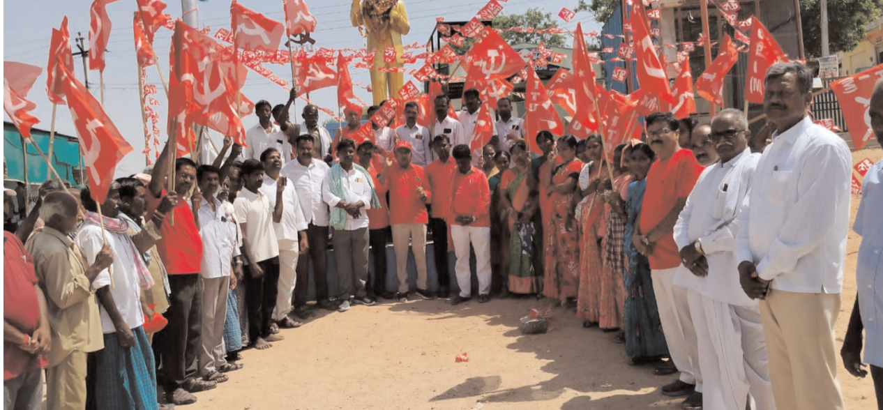
తొలి సమయం, వనపర్తి మే 02