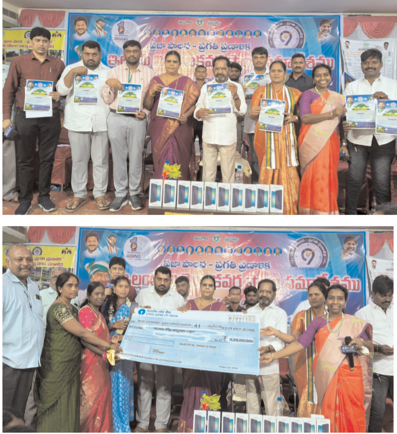
తొలి సమయం, ఇల్లందు;మే, 02: