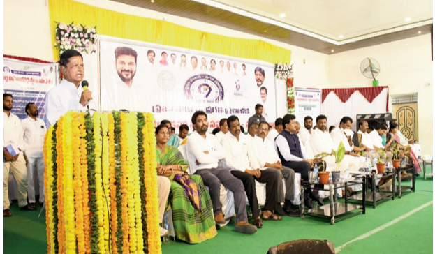
తొలి సమయం, వనపర్తి మే 02