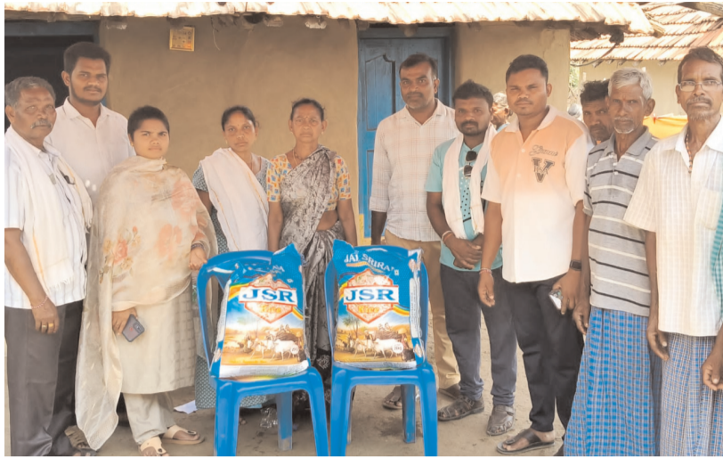
తొలి సమయం కొత్తగూడ 22 మే 2026