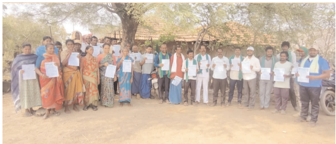
తొలి సమయం కొత్తగూడ 22 మే 2026