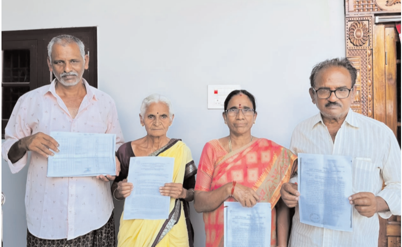
తొలి సమయం, కొత్తగూడెం, మే 26 :

- గట్టుముల్ల భూముల వ్యవహారం వెనుక గల్లీ లీడర్ ల సిల్వీ రాజకీయాలు