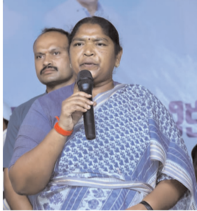
తొలి సమయం కొత్తగూడ 26 మే 2026